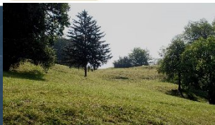
Mitteldifferentialsperre für leichtes Gelände