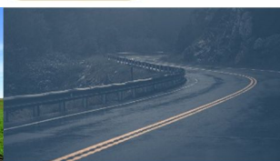
Permanenter 4x4 – Antrieb für Nasses und rutschiges Terrain