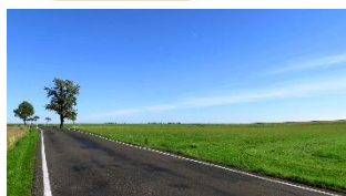
2WD für trockene Strassen