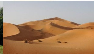
Mitteldifferentialsperre und Untersetzung für schweres Gelände