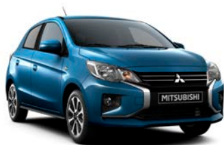
CERULEAN BLUE Metallic