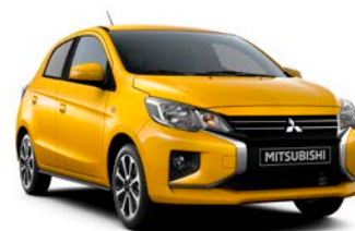
SAND YELLOW Metallic Neu