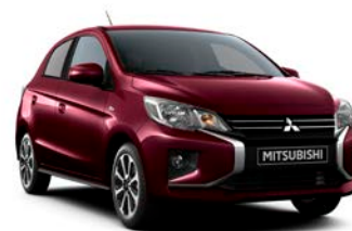
RED WINE Pearl