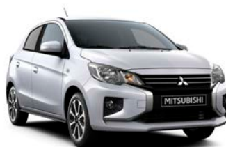
WHITE DIAMOND Premium-Metallic Neu