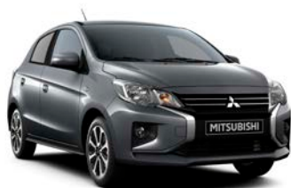
TITANIUM GREY Metallic