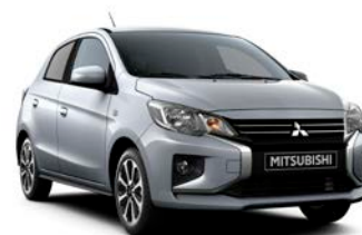
COOL SILVER Metallic