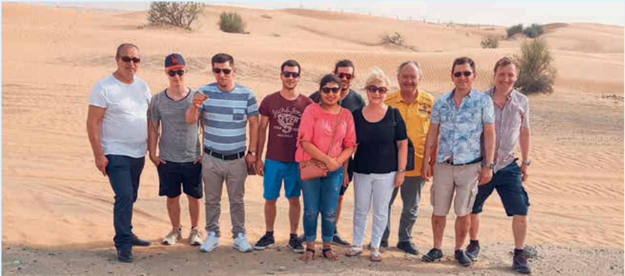
Unvergessliche Jubiläumsreise: das ganze Team reiste nach Dubai und ging auf Wüstensafari.