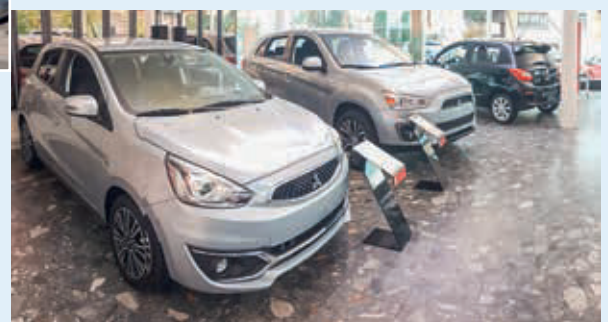
Im Showroom (unten) sind stets die neusten Modelle der Marke Mitsubishi ausgestellt.