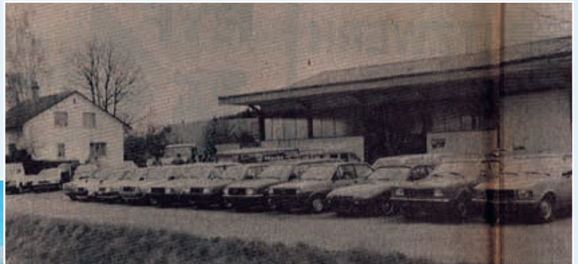
Einst und heute: Auto Gysi war früher an der Wissmatte 6 beheimatet (oben); seit den 90er-Jahren an der Hauptstrasse 9 (links).